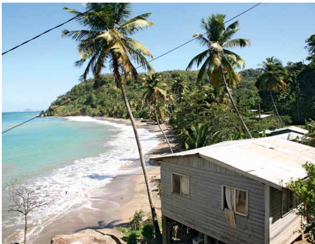
Die idyllischen Küsten der Insel entsprechen so ganz dem Klischee der palmenbestandenen Karibik mit weissen Sandstränden. Vor fünf Jahren aber wütete hier ein Hurrikan.