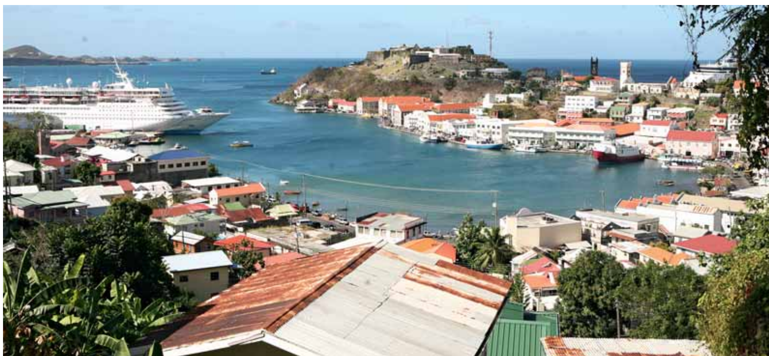
Der kleine Hafen von St. George's wird von vielen Kreuzfahrtschiffen angelaufen, denn Grenada ist ein lohnendes Ziel für Touristen.