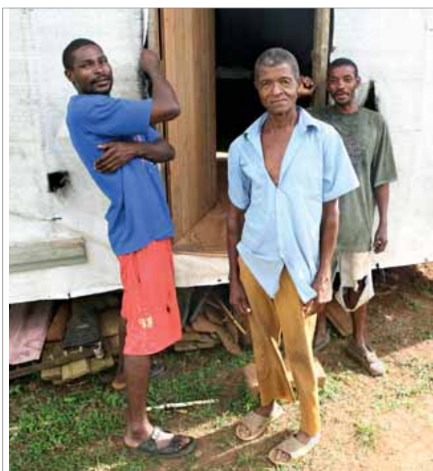
Viele Dorfbewohner leben noch in provisorischen Unterkünften mit Plastikplanen statt festen Wänden.